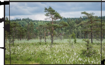
62 ha rikkärr, skogsbetesmark m.m.