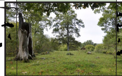
13 ha slätteräng och betesmark