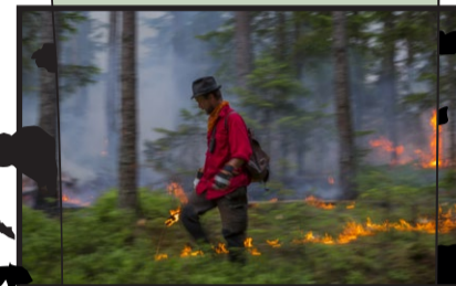
293 ha barrskog, myr m.m.