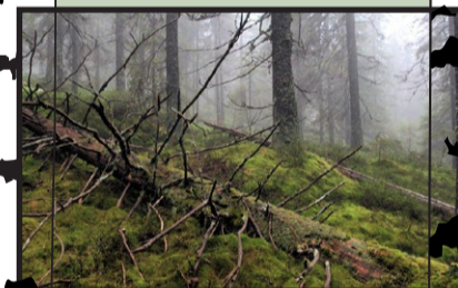
3 ha barrskog, sjö och myrar