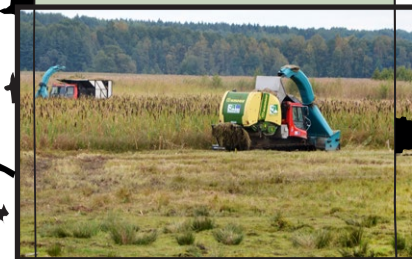
679 ha näringsrik sjö, fuktäng