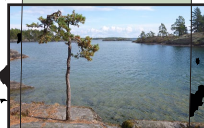
163 ha sjöstränder och barrskog