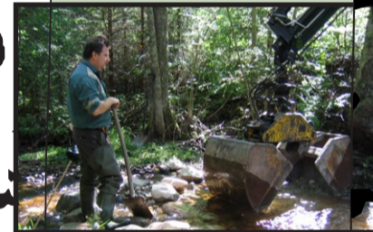
19 ha vattendrag och rikkärr